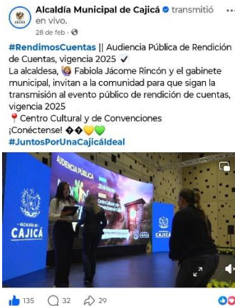
Pieza gráfica de divulgación – Transmisión del evento

Durante la jornada se realizó transmisión en vivo a través de la red social institucional de Facebook de la Alcaldía Municipal de Cajicá, con el propósito de facilitar el acceso de la ciudadanía y promover una mayor participación en este ejercicio de transparencia y control social.