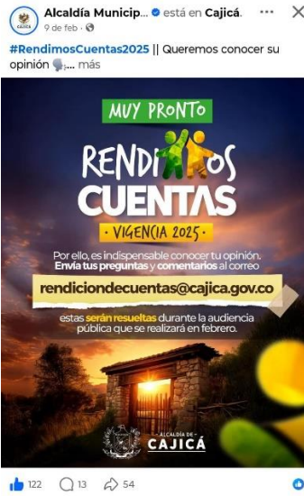
Pieza gráfica de divulgación – canal habilitado para la recepción de preguntas ciudadanas

De igual manera, se socializó oportunamente la información relacionada con los canales y medios definidos para la realización de la audiencia pública, los cuales fueron establecidos por la Alta Dirección, con el propósito de garantizar una mayor cobertura, acceso a la información y participación de la ciudadanía en este ejercicio de transparencia y control social.