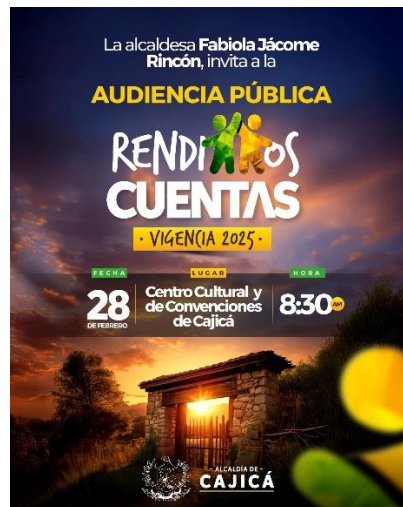
Pieza gráfica de divulgación – invitación al evento

De igual manera, se socializó oportunamente la información relacionada con los canales y medios definidos para la realización de la audiencia pública, los cuales fueron establecidos por la Alta Dirección, con el propósito de garantizar una mayor cobertura, acceso a la información y participación de la ciudadanía en este ejercicio de transparencia y control social.