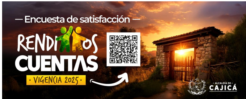
QR Evaluación de evento de Rendición de Cuentas

La encuesta fue divulgada mediante códigos QR ubicados en el auditorio y socializada al finalizar el evento, permitiendo que los asistentes accedieran fácilmente al formulario. El instrumento estuvo habilitado para todos los participantes desde las 9:00 a. m. del 28 de febrero de 2026 hasta las 8:00 a. m. del 2 de marzo de 2026, con el propósito de facilitar la participación y recopilar insumos para la evaluación y mejora continua de futuros ejercicios de rendición de cuentas.