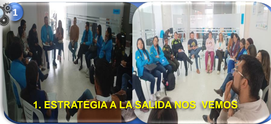
1. ESTRATEGIA A LA SALIDA NOS VEMOS