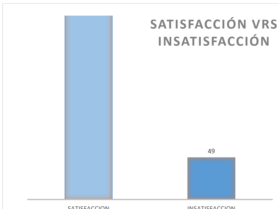
Gráfica 1. Satisfacción vs insatisfacción con la respuesta dada al usuario.

A continuación, se muestra la gráfica de comparación entre la satisfacción e insatisfacción con la respuesta dada al usuario.