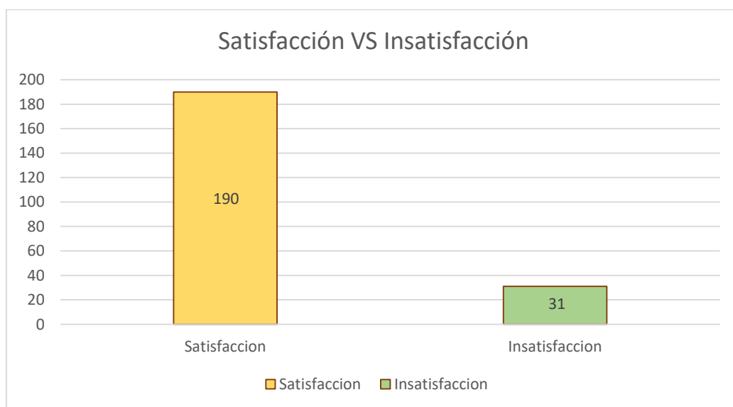
Gráfica 1. Satisfacción o insatisfacción con la respuesta dada al usuario.

A continuación, se muestra la gráfica de comparación entre la satisfacción e insatisfacción con la respuesta dada al usuario.